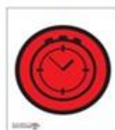
Tijdcontrole registratie passeertijd