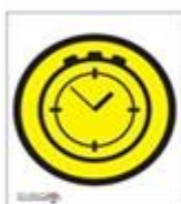
Bemande tijdcontrole bij passeren wordt tijd geklokt