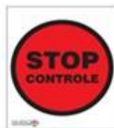
Stop. bemande controle