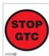
Stop. geheime tijdcontrole