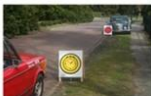
Bemande tijdcontrole, opstelling